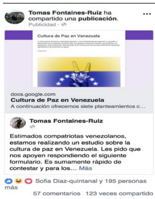
Figura 1. Muestra de la interacción en facebook.

namos normativo y recoge la voz oficial sobre las concepciones estructurales de cultura de paz imbricadas en las políticas educativas venezolanas y sus recursos de instrumentalización. La intencionalidad de creación giró en torno a determinar las tendencias discursivas y nociones estructurales que predominan en el discurso