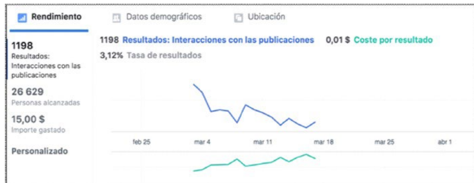
Gráfico 1. Intervalo de gestión de encuesta.