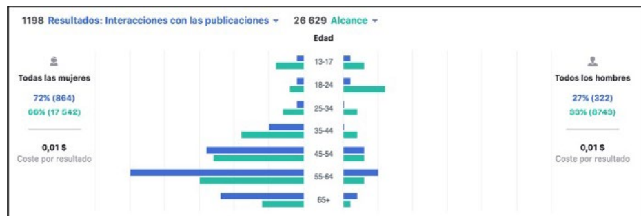
Gráfico 2. Interacción de los sujetos con la encuesta.