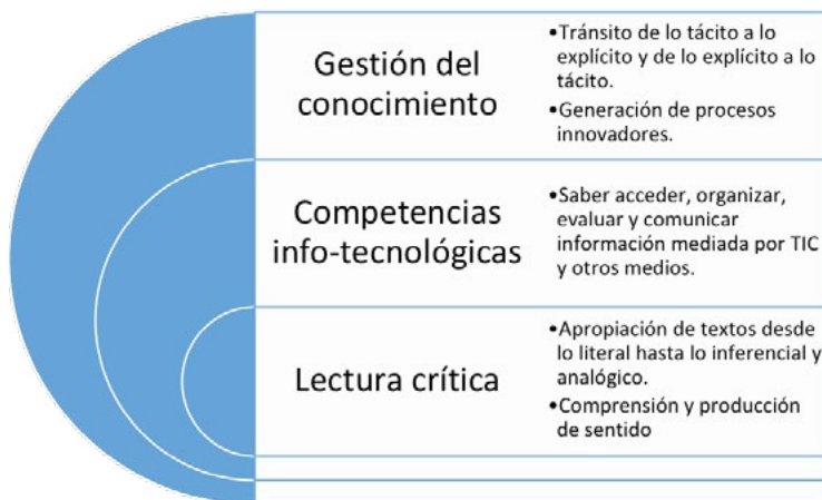
Figura No. 1 Sistema LE-CI-GEC

Lectura crítica, competencias informacionales y gestión del conocimiento.