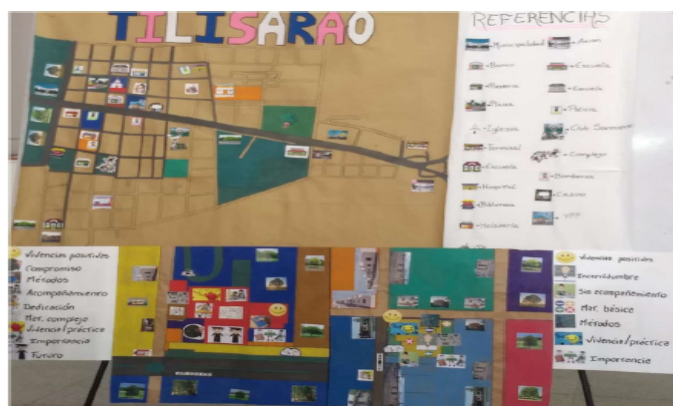
“Vivencias de la enseñanza de las matemáticas en diferentes contextos socio-culturales”

“Vivencias de la enseñanza de las matemáticas en diferentes contextos socio-culturales” Podría profundizarse la producción plasmando de manera gráfica las relaciones/tensiones que se definieron a través de las referencias y las desigualdades según la ubicación de las escuelas.