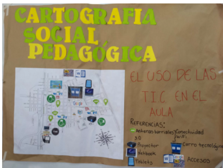
“Uso de las Tic en el aula”

Se sugiere profundizar en las expresiones que verbalizaron durante la exposición oral que respondía dificultad de acceso del internet (por sobrecarga en la red) y además plasmar de alguna manera que la tecnología es brindada por el gobierno de la provincia. Reflejar estos elementos contribuiría a mostrar como las condiciones estructurales del contexto construyen prácticas y estas a su vez construyen el contexto.