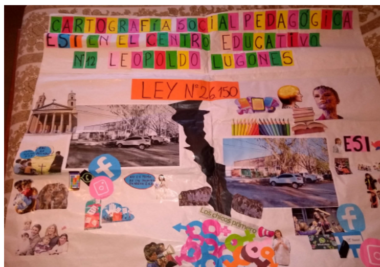
“Enseñanza de la educación sexual integral (ESI)”

“Enseñanza de la educación sexual integral (ESI)” en una institución educativa pública evidencia una fuerte tensión institucional, recoge algunos elementos del territorio que la alimentan. Completaría la producción explicitar quienes son los sujetos de la problemática. La grieta es contundente y marca la situación que se vive ante la ley división de la ley.