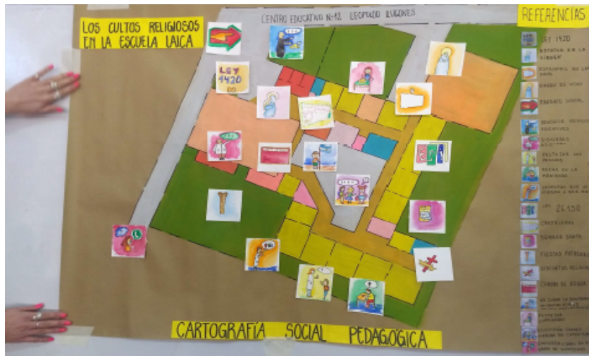
“Los cultos religiosos en la escuela laica”

Desvalorización de la escuela pública muestra el impacto de los huelgas en la ciudad de San Luis en relación a la educación superior, pero queda por fuera de la ciudad de Tilsitarao. Se sugiere profundizar la situación problemática dado que en la cartografía se muestra el contexto de descubrimiento analizado a partir de estadísticas. Si bien sabemos que es un proceso de construcción, la cartografía en esta instancia da cuenta de un esquema de análisis situacional de una problemática y de la relación de mutua conformación que se da entre lo cotidiano y el territorio. La amplitud de espacio geográfico tomado no posibilita representar el tema trabajado además de todos los supuestos que implica establecer relaciones entre desvalorización y paros. Ideal sería que todo fuese explicitado en un mapa.