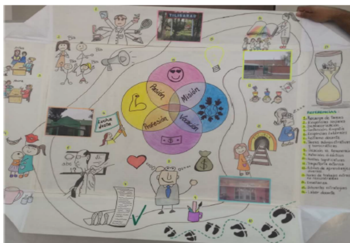
“Percepción de la labor docente en Tilisarao”

“Percepción de la labor docente en Tilisarao”, manifiesta claramente lo que configura a un docente comprometido. Cada ícono y el recorrido que transita un docente durante toda su profesión se observa gráficamente claro. Lo que se dificulta comprender es donde inician sus primeros pasos y los finales de la labor. Sería interesante mapear el labor docente y establecer relaciones con el territorio.