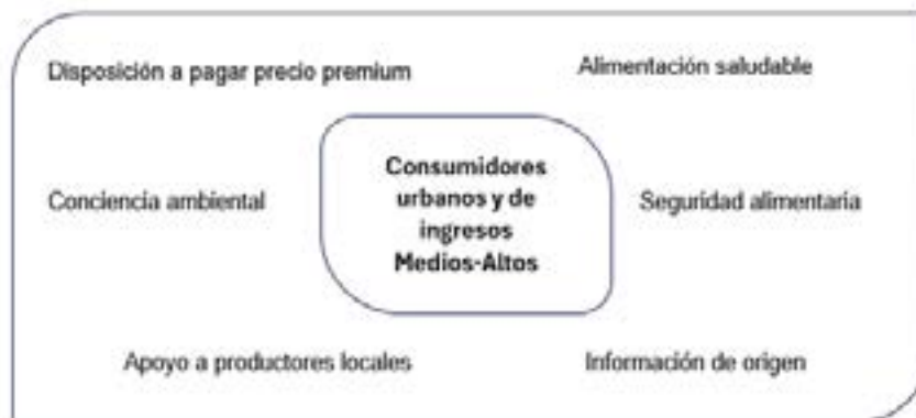
Figura 1. Características de los consumidores urbanos y de ingresos medios-altos.

valor añadido justifica el costo adicional. Priorizan la salud y seguridad alimentaria, adquiriendo productos libres de pesticidas, hormonas y aditivos químicos. Les preocupa el uso sostenible de recursos naturales, la reducción de la huella de carbono y la protección de la biodiversidad por lo que buscan conocer la procedencia del producto y las prácticas de cultivo, para ellos las certificaciones orgánicas o de comercio justo son un factor determinante. Además, apoyan a productores locales y el comercio justo, valorizando el impacto social positivo de sus compras.